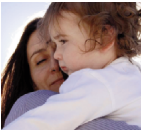
Damit ein Kind nicht Last sondern Segen wird: In einem neuen Projekt finden Mütter Unterstützung.

Im Mai 2008 wird im Erdgeschoss des Diakonischen Werks in der Königstraße 54 ein Beratungstreff mit Second-Hand-Laden für junge Mütter eröffnet. Die Räume sind gleichzeitig Empfangsbereich für die im Haus gelegene Schwangerenberatung.