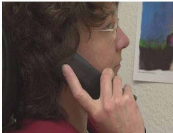
TelefonSeelsorge: Im Schutz der Anonymität über Sorgen und Nöte sprechen. Heute so gefragt, wie vor 50 Jahren.

forderung. Schließlich geht es darum, Menschen zuzuhören, die „keinen Ausweg mehr wissen“.