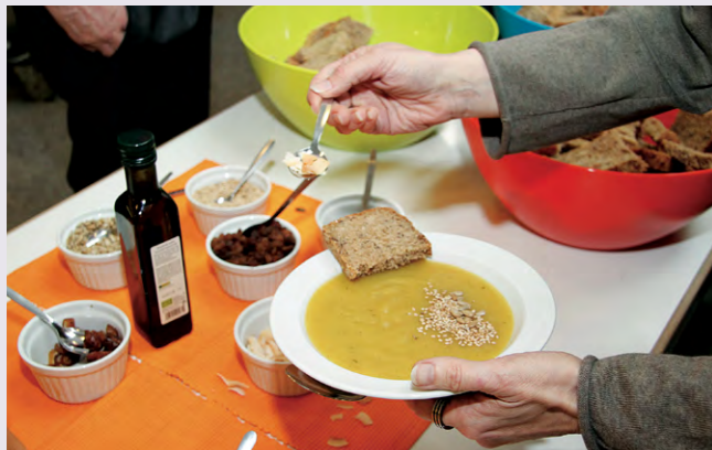
Beim Einführungstag ÖkoFaire Gemeinde gab es vegetarische Kartoffelsuppe, mit leckeren Zutaten individuell verfeinert.

Die Bestandsaufnahme ist ein erster wichtiger Schritt auf dem Weg zu einer ÖkoFairen Gemeinde , denn Sie überprüfen hier die Beschaffungspraxis in Ihrer Kirchengemeinde. Dies soll Ihnen dabei helfen einen Überblick zu erhalten, wer in Ihrer Kirchengemeinde welche Produkte, wo, in welchen Mengen und zu welchen Preisen einkauft. Nur wenn Sie wissen, wie in Ihrer Kirchengemeinde eingekauft wird, können Sie Ihre Einkäufe bewerten und nach Alternativen suchen.