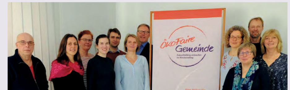
Das Team im Frühjahr 2020 (von li. nach re.):

Wir laden Sie herzlich ein, sich auf den Weg zur ÖkoFairen Gemeinde zu machen. Wir freuen uns über Ihr Engagement und wünschen Ihnen viel Erfolg bei der Umsetzung!