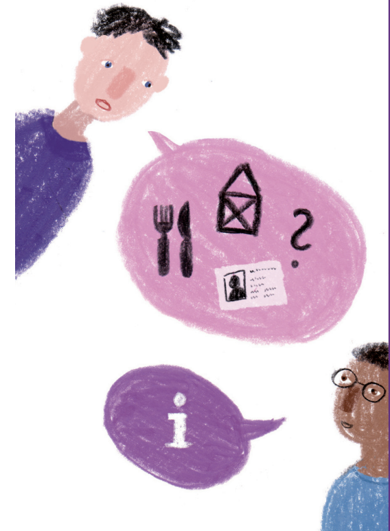
Illustration: Studio Ranokel